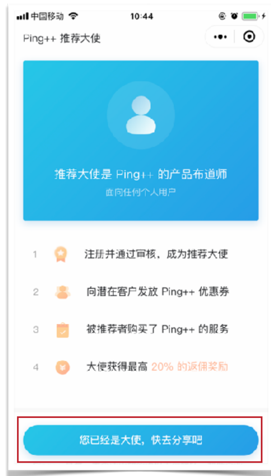
01. 成为大使后， 进入小程序的首页