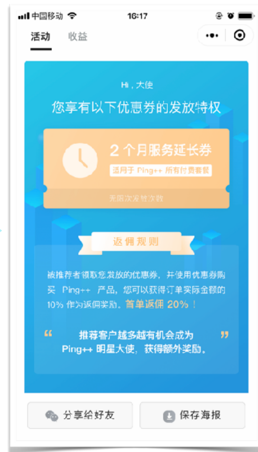
02. 点击首页最下方的分享 button，进入分享页面