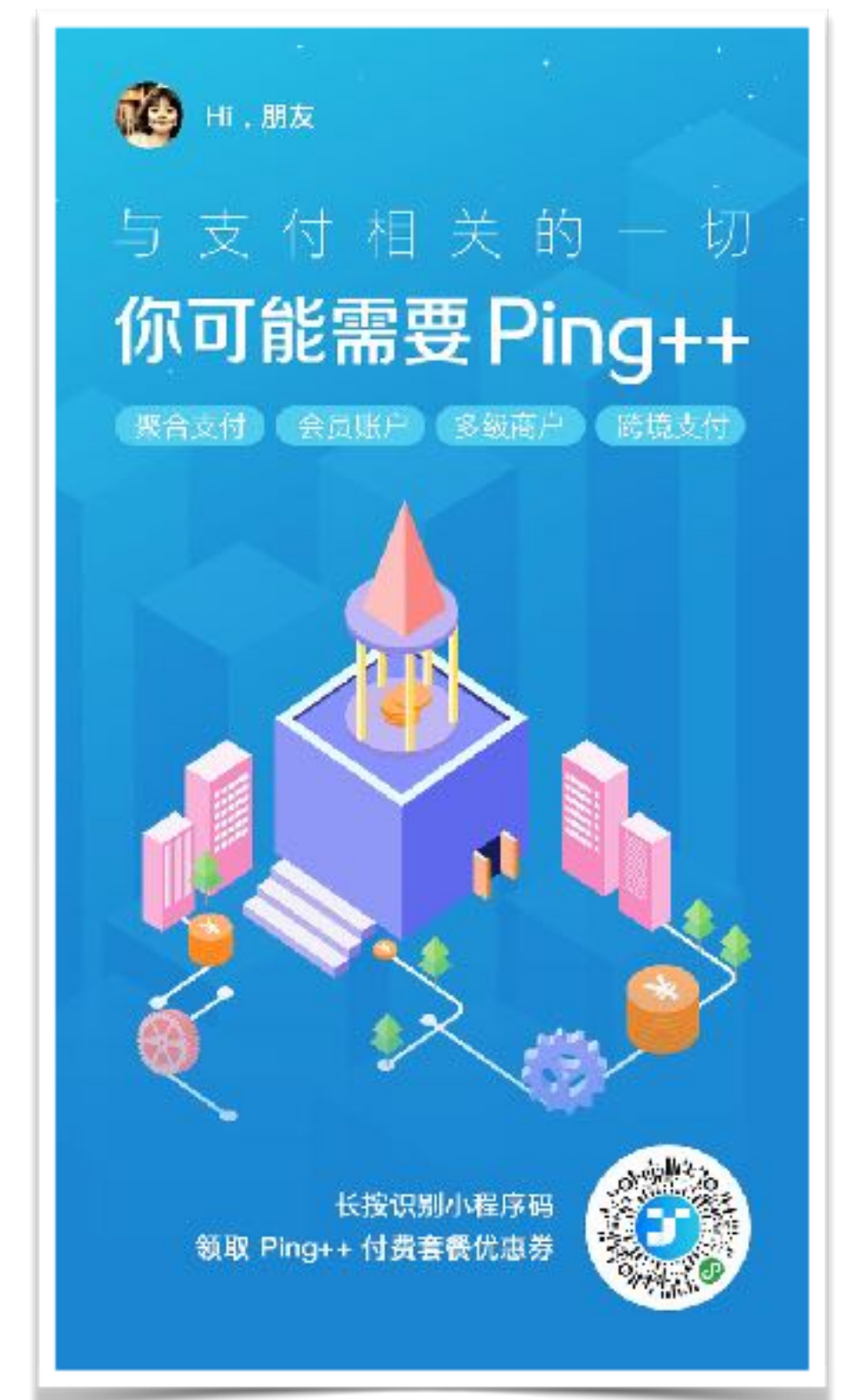
分享方式二： 点击「保存海报」 适合发朋友圈，广撒网