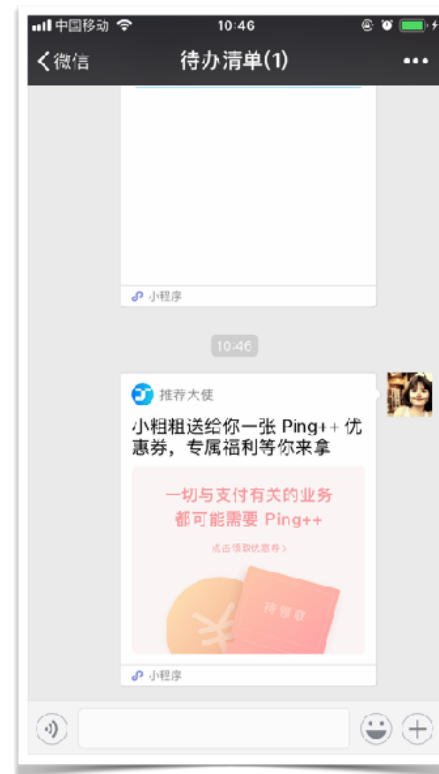
分享方式一： 点击「分享给好友」 适合定向邀请朋友